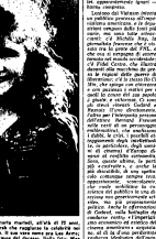
Mae Marsh. Fu la «star» di Griffith